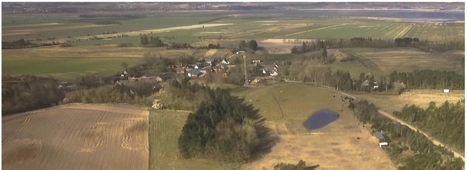
Billede: Kareby med fjord og marker.

Aalborg Universitet 10. semester sociologi 2022