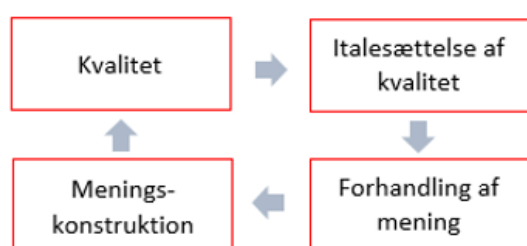
Figur 2: Det dialektiske forhold og konstruktionen af bestemte forståelser (Frit fortolket efter Berger og Luckmann)