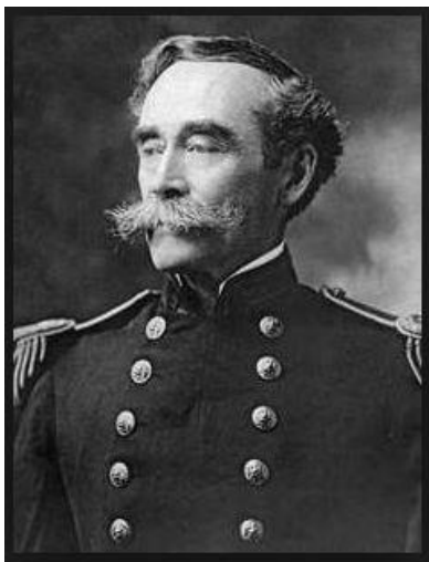
Fig. 3.: Robert Edwin Peary (1856-1920)

Der hersker i denne afhandling en formodning om, at Danmark-Ekspeditionen har et nationalistisk motiv, og at denne i dette tilfælde skulle tage afsæt i landindlemmelse og opretholdelsen af dansk suverænitet i Grønland. Det forholder sig sådan, at der ikke i denne ekspeditions samtid offentligt kunne deduceres hvorledes denne ekspedition havde nationalistiske tendenser gennem en mulig landindlemmelse i Grønland. Dog forlyder det i meget forskning, at det politiske klima i hvilken denne situation udspillede sig, kunne have haft væsentlig indvirken på den ekspedition der senere skulle få det store videnskabelige eftermæle. Altså, at Danmark-Ekspeditionen formodentlig i lige så høj grad som det videnskabelige, har omhandlet kolonialistiske interesser. Denne del af analysen vil derfor belyse de mulige nationalistiske interesser der eksisterer under Danmark-Ekspeditionens udformning.