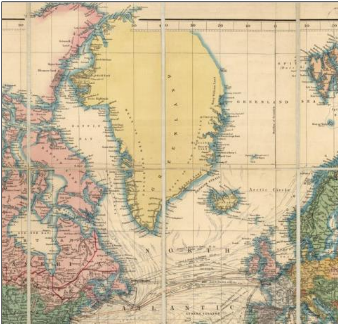
1 Fig. 1.: Uddrag af ”Stanfords World Map” – 1900