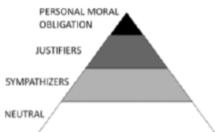
Figure 1. Opinion radicalization pyramid.

Generelt beskrives radikalisering som ‘en proces, hvori en person i stigende grad accepterer anvendelse af udemokratiske og voldelige midler, herunder terror, i et forsøg på at opnå et bestemt politisk/ideologisk mål’ (ibid.: 10). Det er en opfattelse, der ofte illustreres som en individuel, ideologisk motiveret og ensrettet proces mod et voldeligt slutresultat. De fleste regeringer og sikkerhedsorganisationer arbejder fortsat ud fra denne model, og med radikaliseringsdefinitioner, hvor vold, terror og illegitimitet er det centrale. Ofte baseret på en metafor om radikalisering som en slags virus, der kan ‘smitte’ særligt udsatte (Schmid 2011: 75). I academia trækker man på mere nuancerede modeller; fx. de amerikanske terrorforskere McCauley & Moskalenkos ‘The Two-Pyramids Model’: