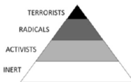
Figure 2. Action radicalization pyramid.

Figur 2. Inquiries.journal . A comparison of radicalization strategies.