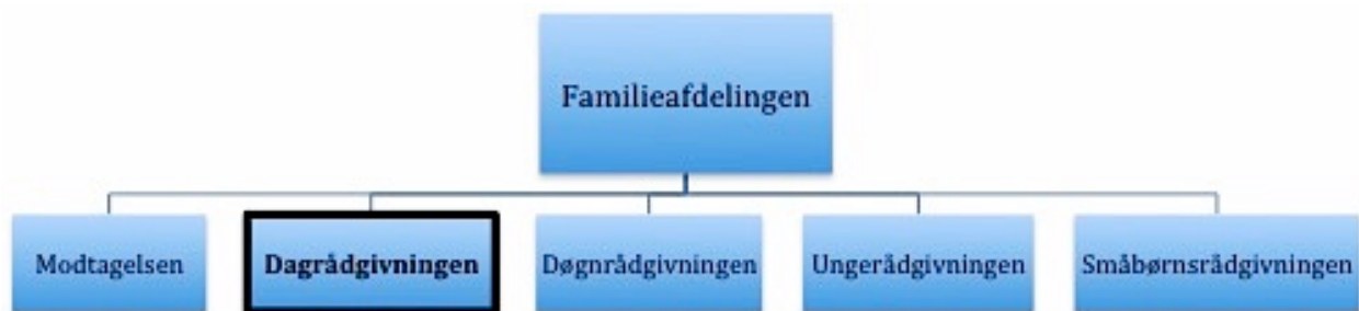
Figur 1: Organisering af familieafdelingen

Det empiriske omdrejningspunkt for dette speciale er en familieafdeling i socialforvaltningen i en stor dansk kommune. I den pågældende kommune udgør familieafdelingen myndighedsområdet for indsatsen rettet mod familier, børn og unge med særlig behov for støtte. Sagsbehandlerne i familieafdelingen betegnes familierådgivere , og alle familierådgivere i denne afdeling har en uddannelsesmæssig baggrund som socialrådgiver. Familierådgiverne har alle myndighedskompetence og forvalter lovgivningen primært med henvisning til paragraffer efter Servicelovens kapitel 11. Familieafdelingen er organiseret således: