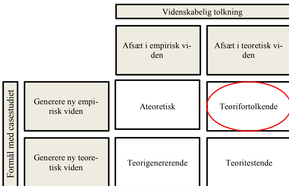
Figur 1: Fire typer casestudier.

Når man taler om kvalitative casestudier, er det som udgangspunkt muligt at identificere fire forskellige typer: Ateoretiske studier, teorifortolkende studier, teorigenerende studier samt teoritestende studier, som det ses i figuren her (Antoft 2012: 33-43).