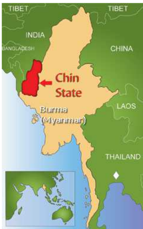
Figur 1 Kort over Chin staten, hentet fra internetavisen "Chinland Guardian.com"

Chinfolket har sin oprindelse i Chinstaten, også omtalt som Chinland, der ligger vest i Burma/Myanmar på grænsen mellem Bangladesh, Indien og Burma/Myanmar. Chinfolket består af flere stammer, der igen kan opdeles i klaner. Der skønnes, at Chinfolket tæller omkring 1 million, hvoraf omkring halvdelen er bosat i