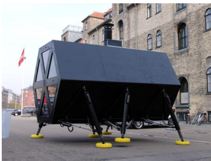
Billede 3 – Kunstnerkollektivet N55's bud på et gående hjem.