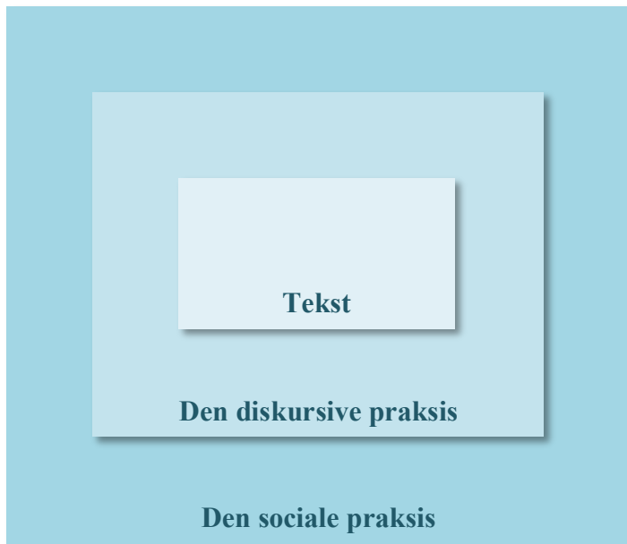
Figur 1 Faircloughs (2008, s. 73) tredimensionelle model