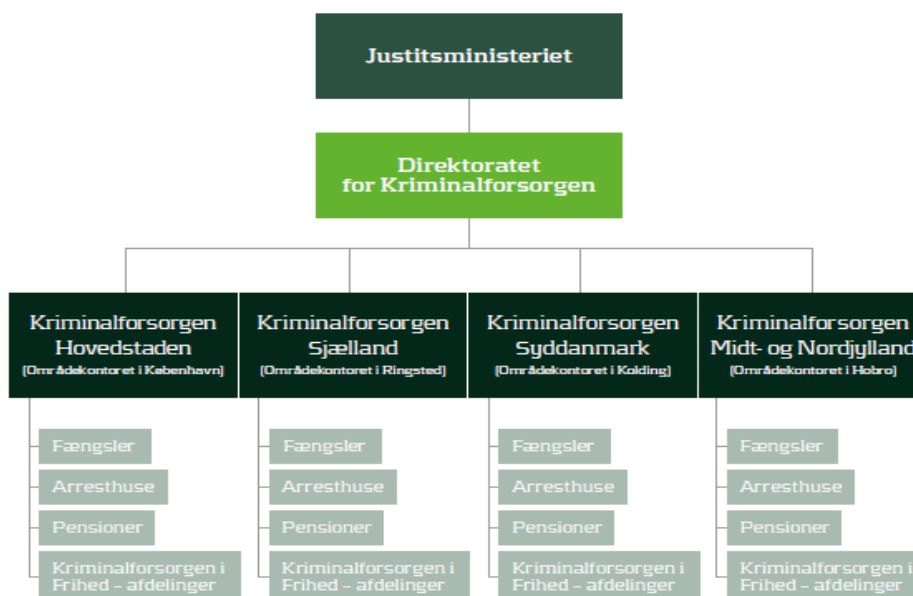
Figur 1 Struktur

Kriminalforsorgen hører under Justitsministeriets ressortområde er organisatorisk fordelt således (Kriminalforsorgen, 2015):