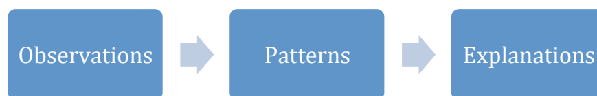
Figure 1: Inductive approach

While the thesis primarily rests on qualitative data material, it also includes quantitative data in the form of secondary statistical data gathered through databases such as Statistics Denmark. The quantitative element is included to establish factual background information and form the basis of arguments.